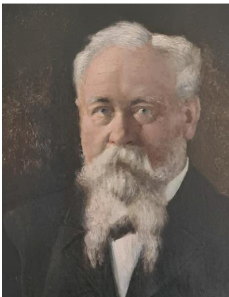
Unser Firmengründer (1837- 1922)